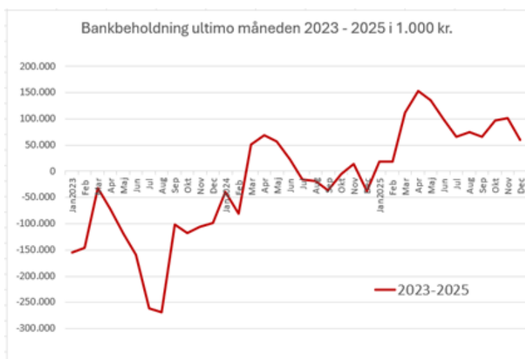
Figur 2: Bankbeholdning ultimo mÃ¥ned 2023-2025

PÃ¥ figuren herunder er vist bankbeholdningen den sidste dag i hver mÃ¥ned som den var i 2023, 2024 og 2025. Som det fremgÃ¥r af figur 2 er der en stigende bankbeholdning over de seneste tre Ã¥r, og hele 2025 har der ikke vÃ¦ret behov for at lÃ¥ne penge i banken til at klare Ã¥rets udsving.